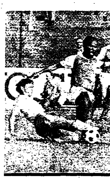
سنة كوروم - اسفرت المباراة التي جرت امس بين فريق منتخب اسرائيل وفريق السويد في كرة القدم من لعامل الفريقين باصابة واحدة لكل منهما .